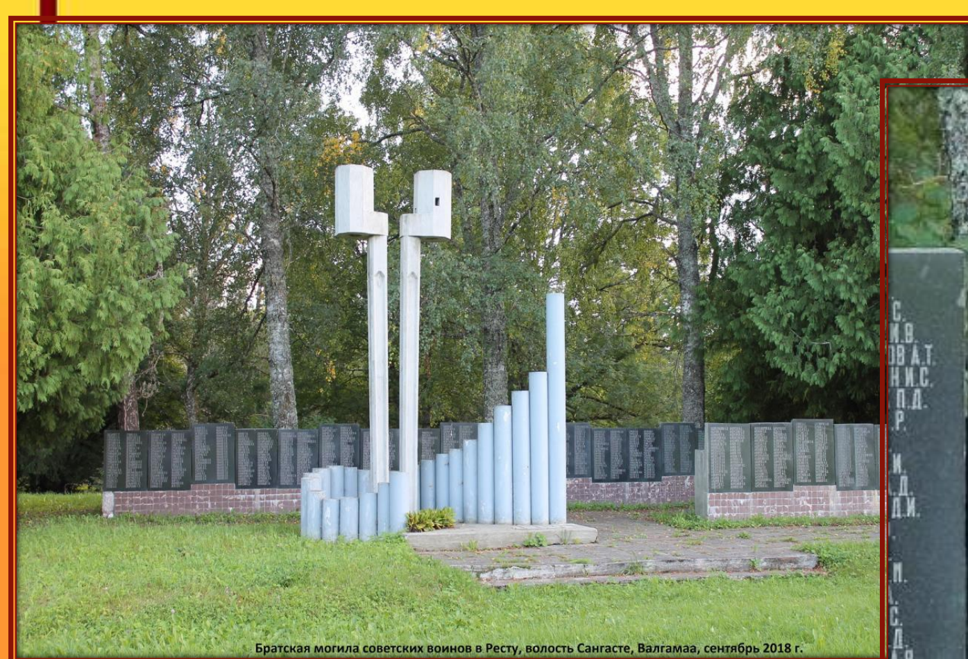
Братская могила советских воинов в Ресту, волость Сангасте, Валгамаа, сентябрь 2018 г.