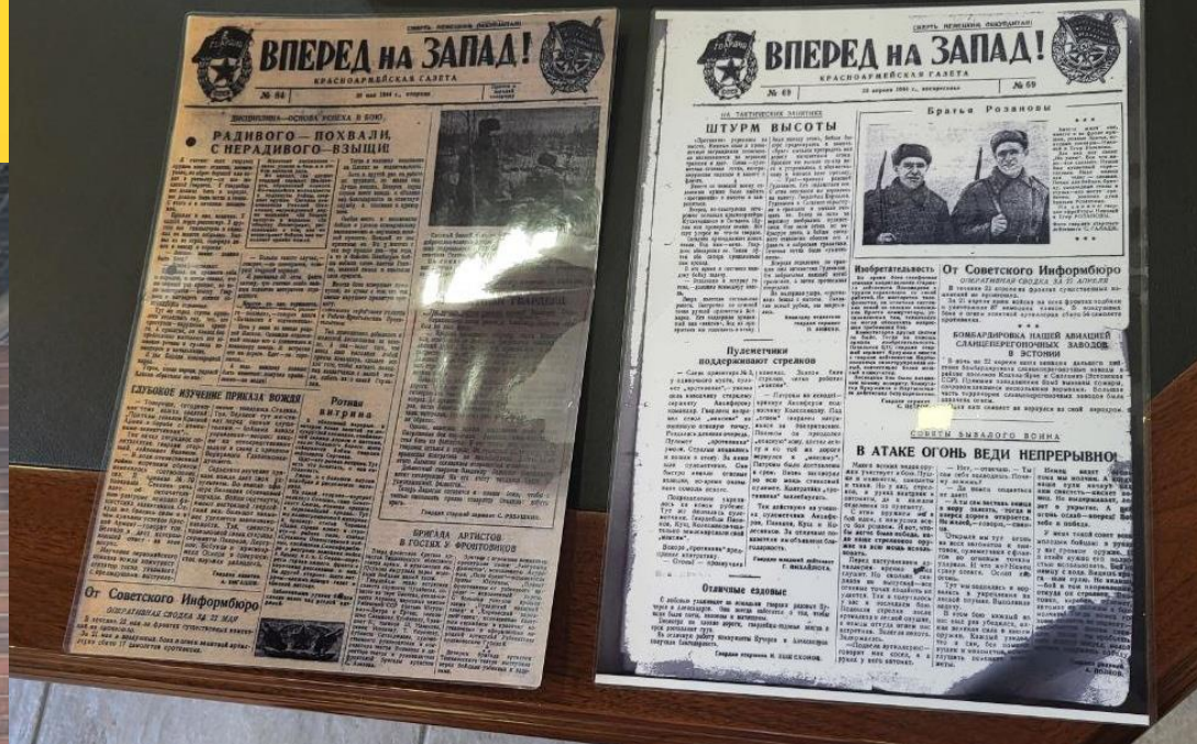
21 мая 2024 года копии газет переданы в Музей «Мосэнерго».